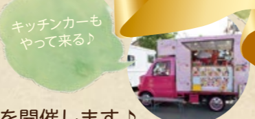
キッチンカーもやって来る!