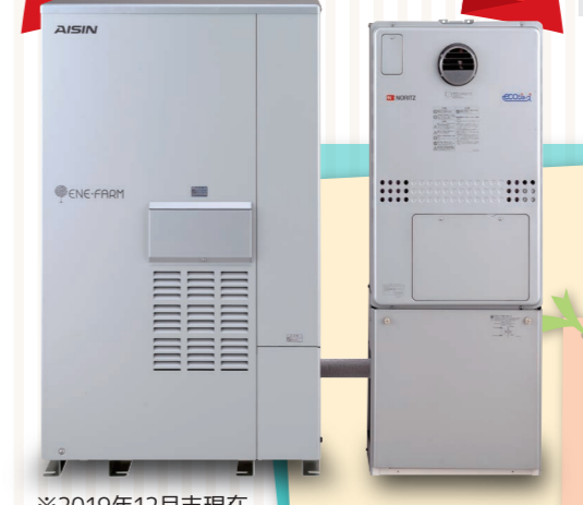
※2019年12月末現在 ※大多喜ガス管内における設置台数