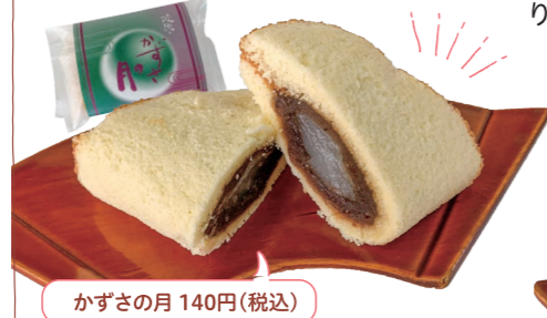
かずさの月 140円(税込)

どら焼き以外にも、色々なお菓子があるんですね。 最中や「かずさの月」も人気がありますよ。最中は 栗最中、小倉最中、ゆず最中の3種類があります。「か ずさの月」は、カステラ生地で餡子と求肥を挟んだ お菓子です。カステラ生地が甘いので、餡子は甘す ぎないように調整しています。焼き菓子の他にも、 お赤飯や紅白まんじゅうなどもご注文があればお作 りしています。