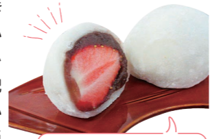
いちご大福 200円(税込)

最後に今の時期のおすすめをお願いいたします! 春はやっぱりいちご大福と桜餅。どちらも4月半ばま では販売していますが、いちごは良い物ができないと 仕入れられないので、毎年何日までと決まってい ないんです。ごろっと大き くジューシーで、きれい に赤く熟したいちごしか 仕入れていません。求肥 ではなくお餅で作ってい るので、いちご大福の消 費期限は当日限り!作り たての一番おいしい状態 で味わっていただきたい です。柏餅、水まんじゅう、おはぎなども季節によ って販売しております。