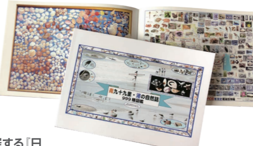
九十九里・渚の自然誌 999種図鑑 発行：一宮ウミガメを見守る会