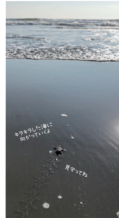
キラキラした海に 向かっていこう

年に一度、日本全国のウミガメに関係する人々が集まり開催する「日本ウミガメ会議」。一宮ウミガメを見守る会の記録が発表される場となり、まだ明らかにされていないウミガメの生態を解き明かすデータのひとつとなりました。千葉県にはウミガメがやって来る浜があります。人とウミガメが共存できる海を守りましょう。