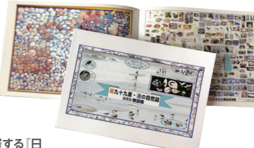
南九十九里・渚の自然誌 999種図鑑 発行：一宮ウミガメを見守る会