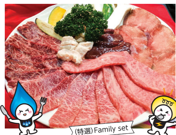
(特選) Family set

お店のこだわりはなんでしょうか。 厳選した和牛の生肉を使用しているため旨みが強いです。冷凍では解凍時に肉汁が流れ出て味と食感が落ちてしまうので(タンはスライスの為冷凍)。炭火でぜひご堪能いただきたいですね!