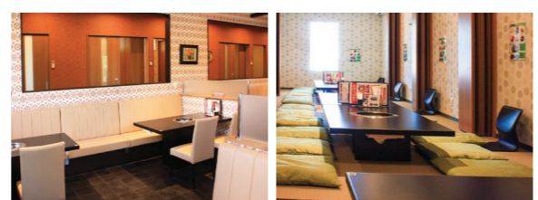
※ 本記事は、2020年9月30日(水)時点での取材をもとに編集しております。

宴会コースはある? ご予算・人数に応じてお客さまのご要望に応えられるようお作りしますのでお任せください! ご予約はお電話にて承ります。消毒や席の間隔などコロナ対策も万全ですぜひご来店お待ちしております!