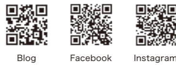
Blog Facebook Instagram

お料理の写真がたっぷりのSNSはコチラ Instagramのオンラインレッスンも好評配信中です。