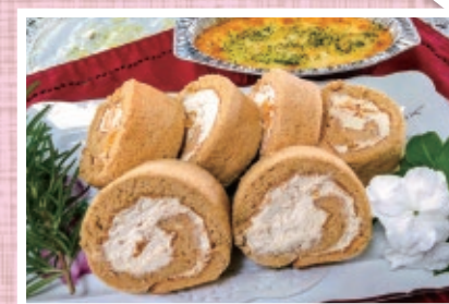
「絶品!家庭料理」受講のお客さまの声