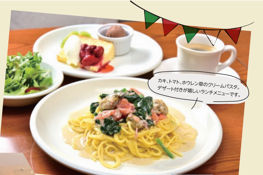
カキ、トマト、ホウレン草のクリームパスタ。デザート付きが嬉しいランチメニューです。