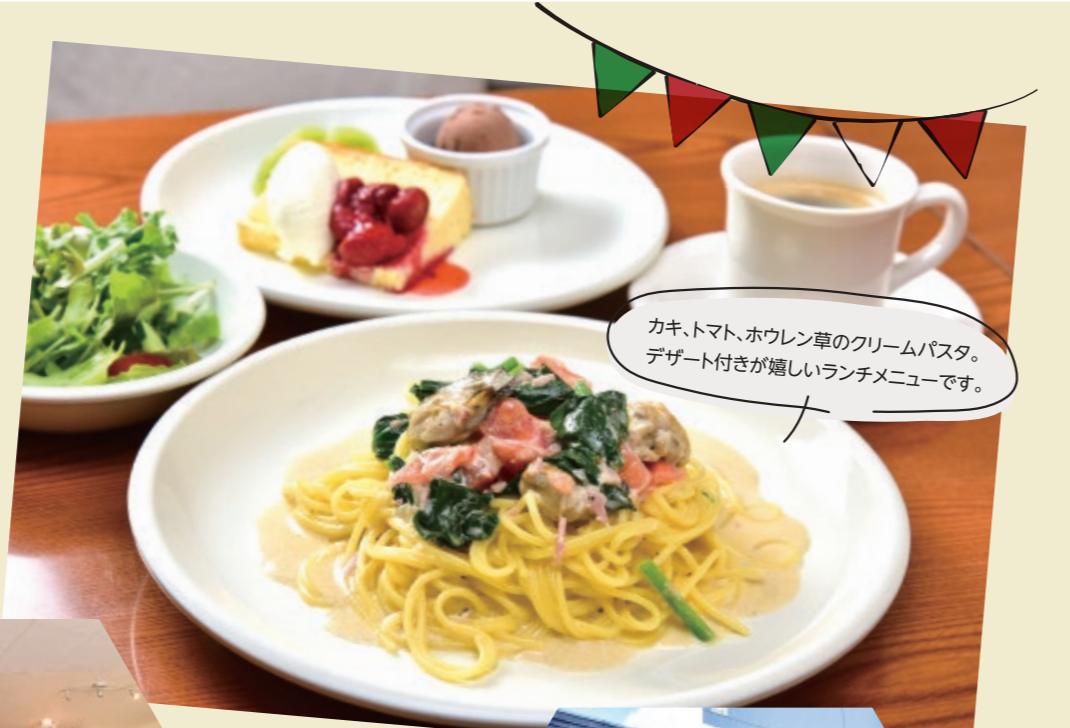
カキ、トマト、ホウレン草のクリームパスタ。デザート付きが嬉しいランチメニューです。