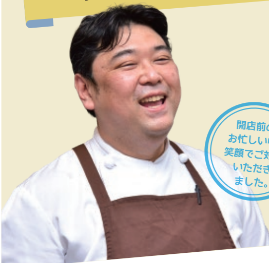
開店前のお忙しい中、笑顔で対応いただきました。