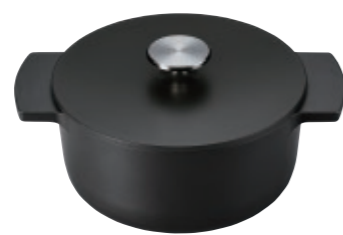
Rinnai RBO-MN22 (MB) メーカー希望小売価格 27,500円(税込)