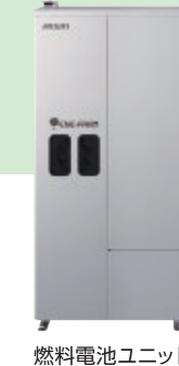
燃料電池ユニット