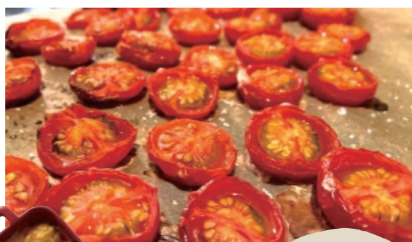
旨みがギュッと濃縮された、セミドライトマト。