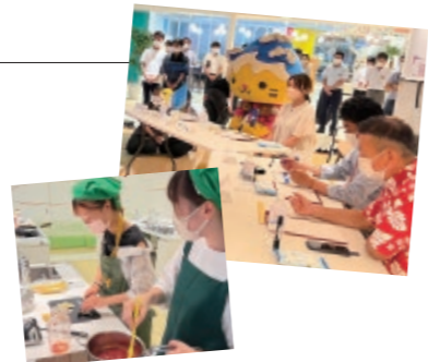
城西国際大学のHPでも活動が紹介されています

企画のキッカケは、今年2月に行われた『国際ホテルレストランショー』でピザ窯に出会ったことでした。そこで、群馬県で地元の食材を使ったピザを1カ月に800枚も販売している道の駅があると知り、千葉県にもおいしい海産物や乳製品があるので、それらを使ってピザを作ろうと思いついたのです。学生は2人1チーム、全6チームに分かれ、くじ引きで決まった食材でピザを考案しました。7月15日金に大多喜ガスショールームBeEにて行われた予選会で「海の駅九十九里」で販売する2つのピザが決まり、皆様にご試食いただくことになりました。