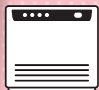
ガスファンヒーター