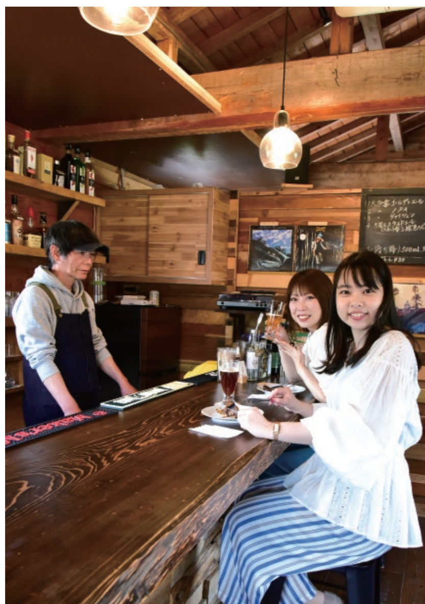
ビールのテイスティングをしながら、お店の魅力を伺います。

大多喜ガスと同じく、「大多喜」が名付けられたクラフトビールの醸造所があります。試行錯誤を重ねた、その“こだわり”への思いとクリアで奥深いその味わいを目指して新緑が眩しい大多喜町へ、当社スタッフが足を運びました。