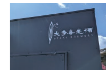
イベントで使用する車にも「大多喜麦酒」のロゴが。地名と店名を広める一環となっています。