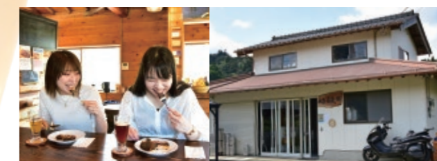
ビールとの相性抜群のメニューに、当社スタッフも舌鼓!