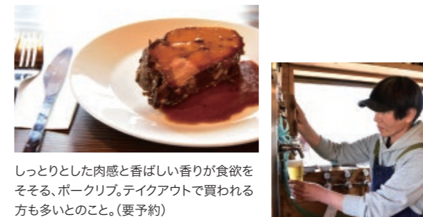
しっとりとした肉感と香ばしい香りが食欲をそそる、ポークリブ。テイクアウトで買われる方も多いとのこと。(要予約)