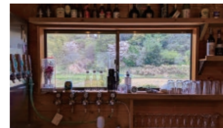
ビアバーのカウンター席から、窓越しに田園風景が見えます。

前職は、都内のアパレル会社のデザイナー。ロンドンで本場のビールと出会い、その美味しさに惹かれたこともあって現職を目指すことになりました。栃木マイクロブルワリー、岩手県のサクラブルワリーなど、関東や新潟、数社のブルワリーにて研修を重ね、醸造所の開所に尽力しました。機材選びや味の調整など、お世話になったブルワリーからのサポートがあったからこそ、今のクリアな味わいが生まれたそうです。